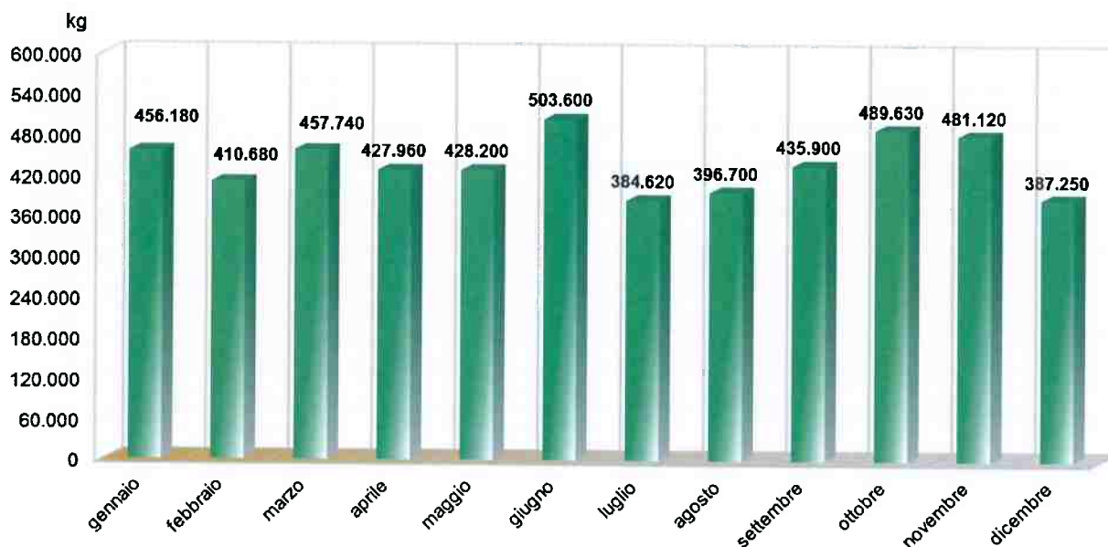
Rifiuti totali trattati mensilmente nel corso del 2015