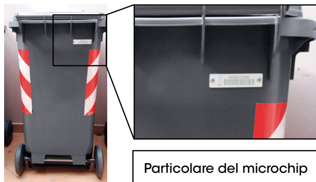
Particolare del microchip

À partir du 13 mai 2019, la collecte porte-à-porte des déchets Non-recyclables aura lieu toutes les deux semaines pour tous les usagers, particuliers et professionnels. Les jours de collecte sont signalés dans le calendrier disponible au Point d'application du microchip.